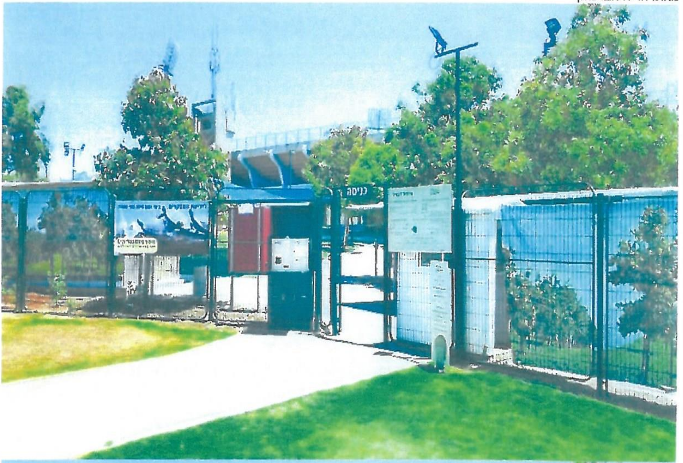
החי פארק בכפר סבא.