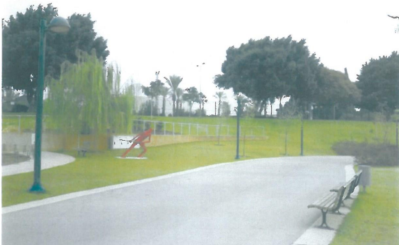
הפארק העירוני בכפר סבא.

בהמשך נכתב כי מנהל החי פארק לווה צב סודני יקר ערך שנרכש על ידי העירייה לפעילות פרטית, וזה מעולם לא שב אל החי פארק וככל הנראה אבד. לפי הדוח, עובדים טוענים כי הדבר דווח למנהל הפארק, ששמר את המידע אצלו. עוד לקח ארגנטרו מחי פארק תוכי מיוחד לצורך שידוך עם תוכי פרטי שלו, ומעולם לא הושב. כמו כן, לפי הדוח, גוזלים של ציפור ייחודית (רוזלות), בשווי של כ-2,000 שקלים לגוזל נעלמו. "לדברי עובדי החי פארק בפנייה אל מנהל החי, נמסר להם ראשית כי הגוזלים מתו. לאחר מכן, בשיחה טלפונית הודה מנהל החי כי גוזל אחד אצלו והוא מאכיל אותו בניסיון להצילו".