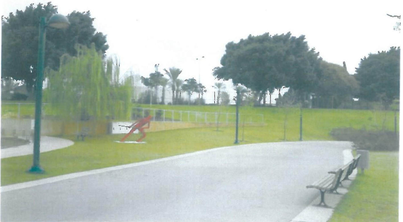
הפארק העירוני בכפר סבא.