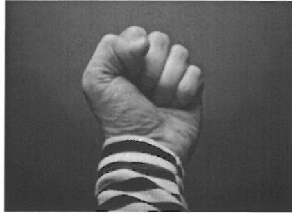
תקף את הפקח (תמונה להמחשה)