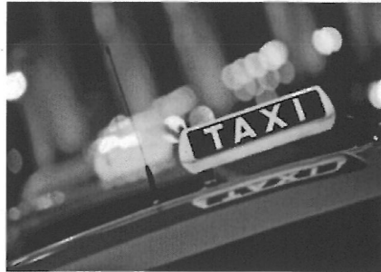
נהג המונית תקף את הפקח (תמונה להמחשה)