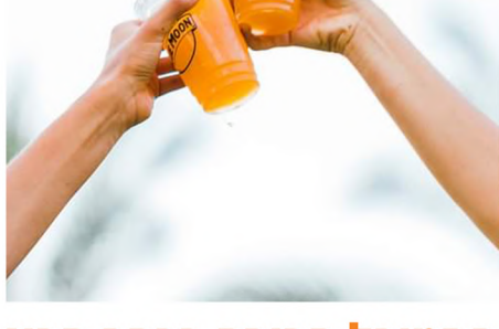
לחצו להמשך קריאה

פסטיבל הבירה בכפר סבא הפסטיבל הביא את חובבי הבירה, הקולינריה והמוזיקה לחגיגת קיץ