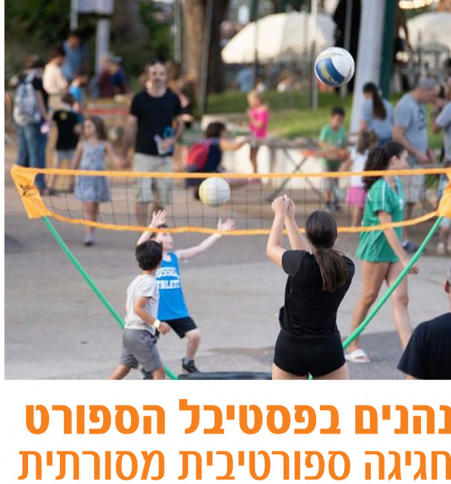
לחצו להמשך קריאה

בכפר סבא חולקו תעודות הוקרה ומלגות לתושבים על תרומה קהילתית