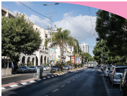
רחוב ויצמן כיום.