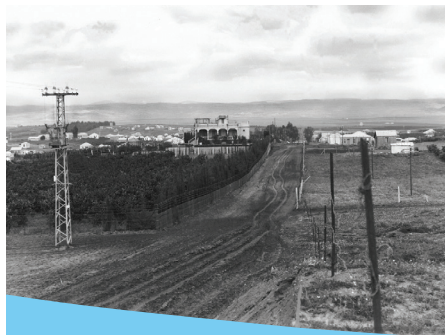
רחוב ויצמן בתחילת הדרך.